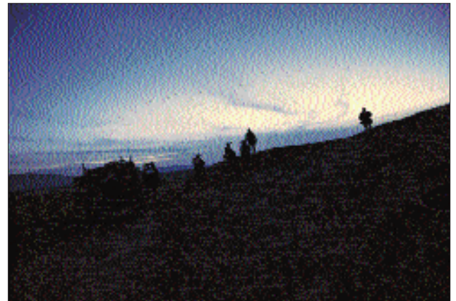
Die Natur ist überwältigend

satzes eine umfangreiche Vorausbildung, in der nahezu alle erdenklichen Szenarios in Form von Ausbildung am Heimatstandort, aber auch durch Ausbildung in Ausbildungseinrichtungen der Bundeswehr geübt und bis zum Beherrschen