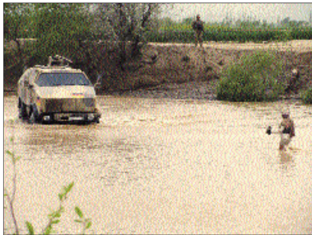
Gewässerübergänge waren immer eine Herausforderung

Mobiltelefone als Führungsmittel, um schnell und effektiv kleine Trupps aus der Umgebung zu aktivieren und diese in das Gefecht zu befehlen. Diese Taktik wurde uns am 23.06.2009 zum Verhängnis. Bei einer Operation unserer Kräfte im Distrikt Chahar Darreh gelang es dem Feind, seine Kräfte blitzartig zusammenzuführen und von drei Seiten auf die eigenen Stellungen antreten zu