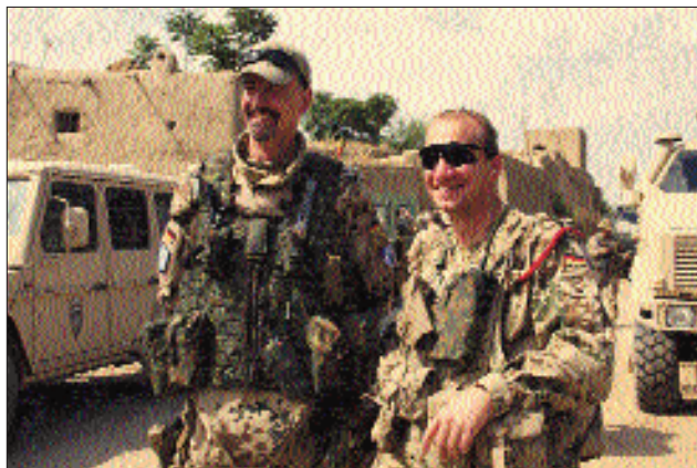
Die Kameradschaft hält die Truppe zusammen

zur Verfügung und die Erfahrungswerte, die bei diesem SPz vorhanden sind, sind nicht in der kurzen Einsatzvorbereitungszeit mit Dingo und TPz zu erreichen. Insgesamt sollten dann auch aus meiner Sicht die Einsatzkräfte in Afghanistan durch Panzergre-