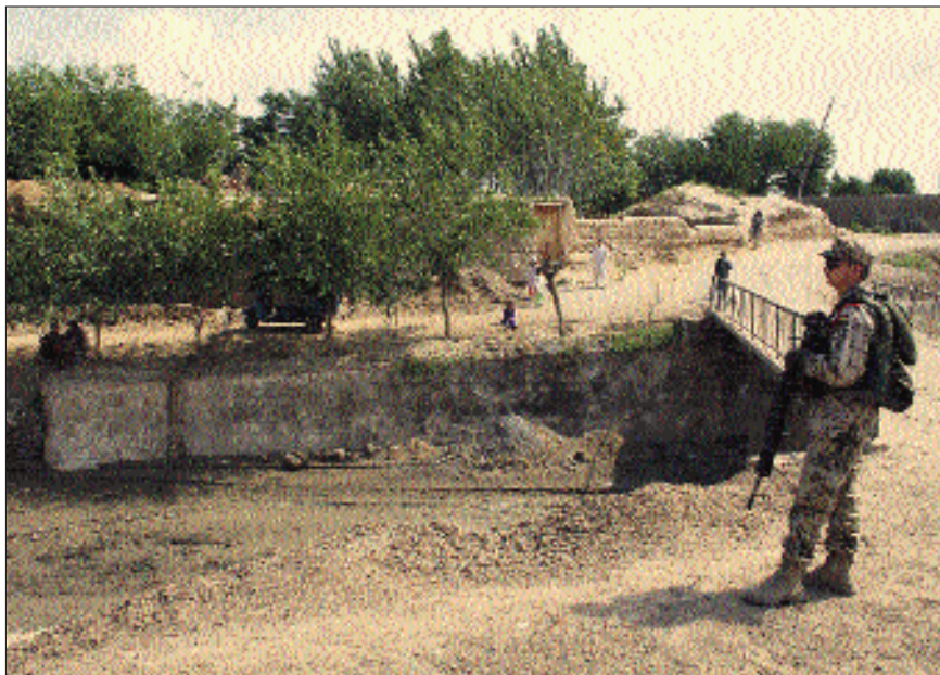
Die Gefahr lauerte überall und ständig

Der SPz hat durch die BMK eine hohe Feuerkraft, große Reichweite, Wärmebildgerät, Panzer- und Minenschutz im Gefecht mehr Einsatzmöglichkeiten als Dingo und Fuchs. Außerdem steht der SPz der Panzergrenadiertruppe ständig