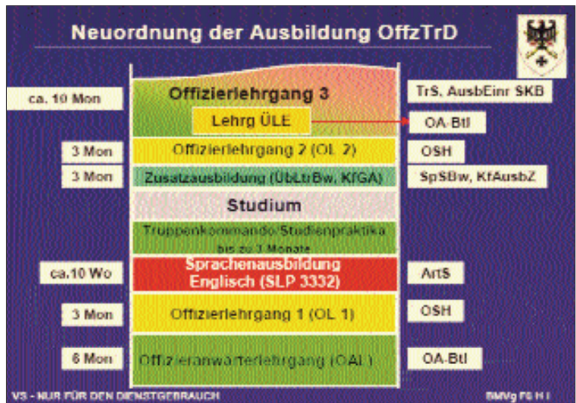
Die Einordnung des Studiums in den Ausbildungsgang OffzTrD mit Studium

Mit vier Jahren Regelstudienzeit ist der Aufenthalt an einer der Universitäten der Bundeswehr der mit Abstand längste Ausbildungszeitraum. Gerade deswegen und wegen der immens großen Bedeutung des Studiums während und nach der Dienstzeit sollte jeder Kamerad das Beste aus dieser Zeit herausholen; akademisch, dienstlich und privat.