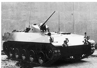
RU 261 aus dem Jahr 1964 – nun ist der gesamte Triebwerksblock im Bug installiert. Im Heck ergab sich damit eine große Ausstiegsöffnung für die Panzergrenadiere